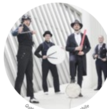
Quatuor Beat