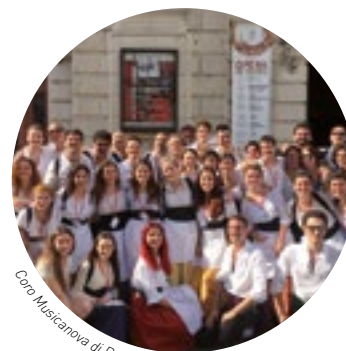
Coro Musicanova di Roma