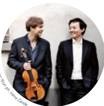
Mönkemeyer-youn ph. Irène Zande