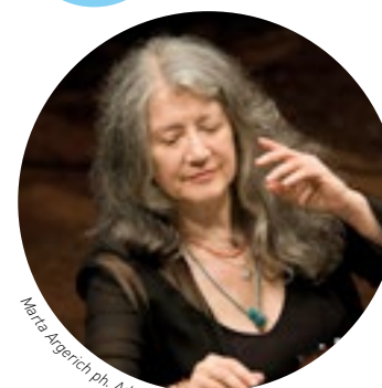
Martha Argerich