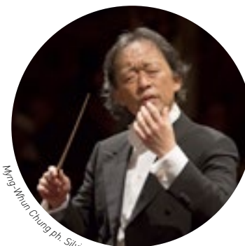
Myung-Whun Chung