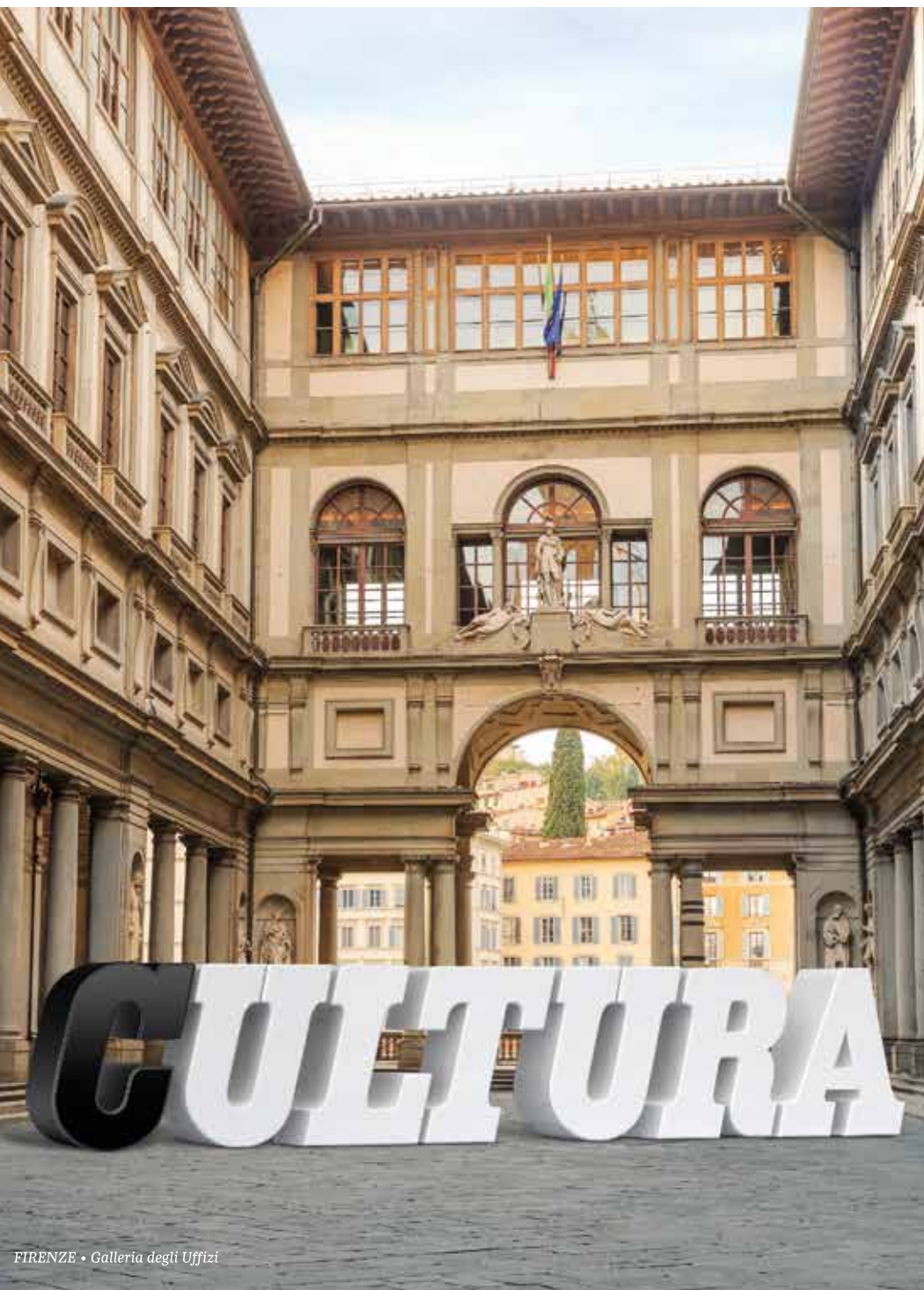
FIRENZE • Galleria degli Uffizi