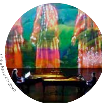
Ufuk e Bahar Dördüncü