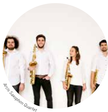
Arcis Saxophon Quartet