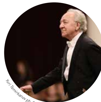
Yuri Temirkanov