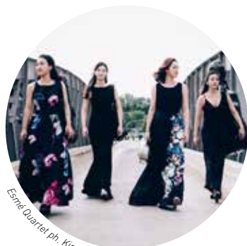
Esmé Quartet