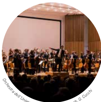
Orchestra dell'Università degli Studi di Milano