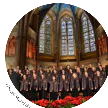
I Piccoli Musicisti di Casazza