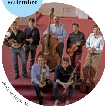
Regio Septet, ph. Marcello Jaconetti

Teatro Elfo Puccini, Sala Shakespeare ore 21