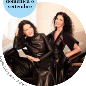
Katia e Marielle Labèque