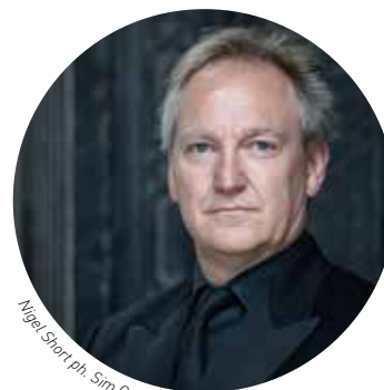
Nigel Short