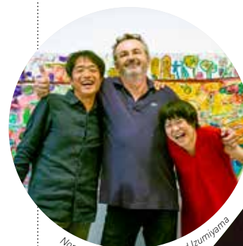
Nomura, Moretti, Yabu ph. Road Izumiyama