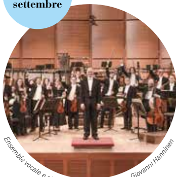
Ensemble vocale e strumentale laBarocca