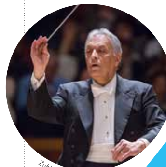
Zubin Mehta