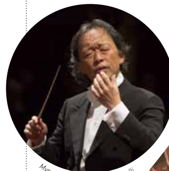
Myung-Whun Chung