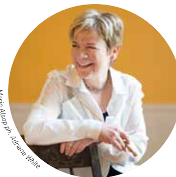
Marin Alsop