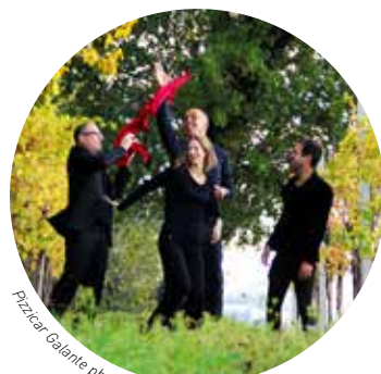
Pizzicar Galante